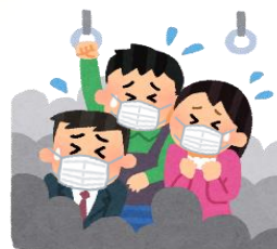
混雑した乗り物の中