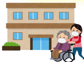
高齢者施設など に行くとき